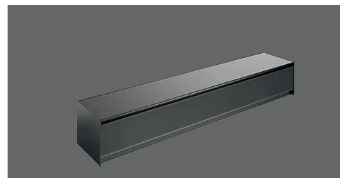
Photo indicative / non contractuelle. Peut ne pas correspondre à la version du produit sélectionné