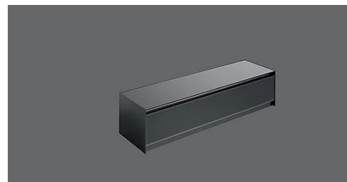
Photo indicative /non contractuelle. Peut ne pas correspondre à la version du produit sélectionné