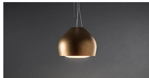
Photo indicative /non contractuelle. Peut ne pas correspondre à la version du produit sélectionné