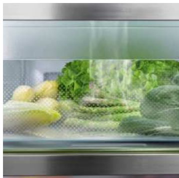
BioFresh avec HydroBreeze

Vous souhaitez disposer d'un refroidissement professionnel de vos fruits et légumes ? HydroBreeze saura vous inspirer : la brume fraîche, combinée à la température du compartiment à peine supérieure à 0 °C, donne aux aliments le coup de pouce supplémentaire pour une plus longue durée de conservation. L'effet visuel est également impressionnant. HydroBreeze est automatiquement activé pendant 4 secondes toutes les 90 minutes et pendant 8 secondes lorsque la porte est