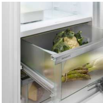
Compartiment Fruit & Vegetable

Une source d'eau potable et fraîche directement dans votre cuisine : cela ressemble à un conte de fées, c'est InfinitySpring. Le distributeur permet de se servir en eau sans faire couler de gouttes et garde l'eau fraîche et à disposition en continu. Il suffit d'appuyer sur le sigle avec la carafe ou le verre pour en profiter. Vous économisez ainsi sur l'achat de bouteilles d'eau et faites une bonne action pour la planète.