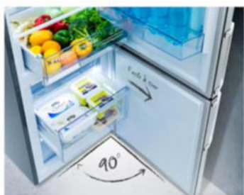
Ouverture à 90° sans débord

Grâce à l'ouverture de porte sans débord, il est désormais possible d'installer le réfrigérateur directement contre un mur. Il est également possible d'utiliser l'ensemble des tiroirs en toute simplicité.