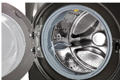
Tambour grande capacité