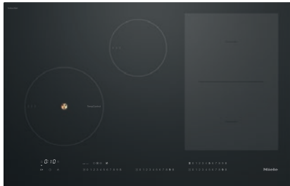
Table de cuisson à induction avec TempControl pour un rôissage parfait

Code EAN: 4002516339434 / Numéro de matériel: 11512260 / Ancien Numéro de matériel: 26787970F