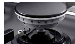
Brûleur A+ monobloc

Véritable cuisson au wok : brûleur Volcan fusion wok, Rendement élevé, 67% d'énergie consommée : brûleur A+, Cuisson précise : grande amplitude de réglage, Confort : brûleur monobloc pour un nettoyage facile