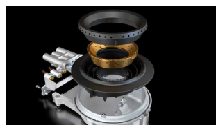
Fusion Volcan Wok